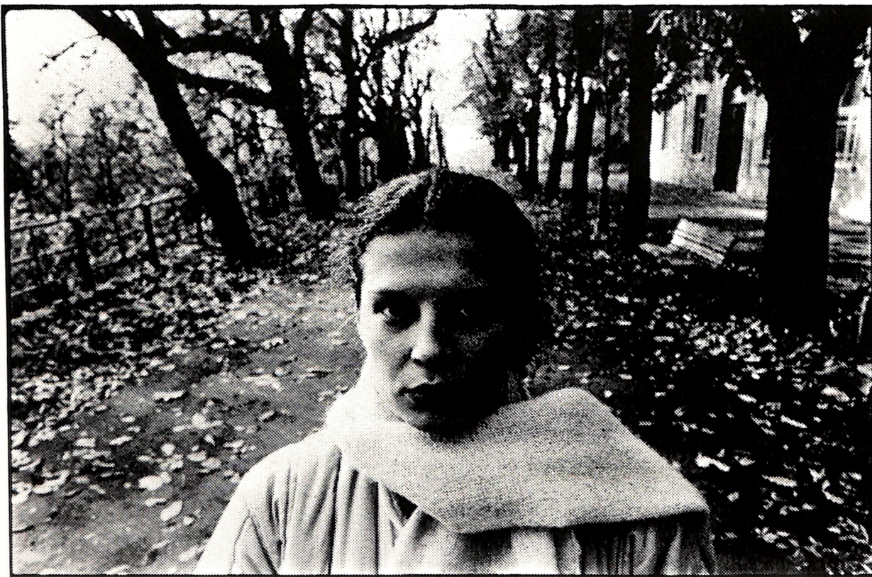
„ LICE N°1 ”